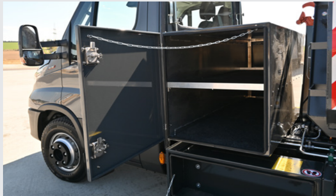
Systemschrank hinter dem Fahrerhaus