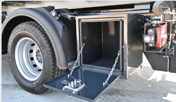
Weitere Werkzeugkisten möglich