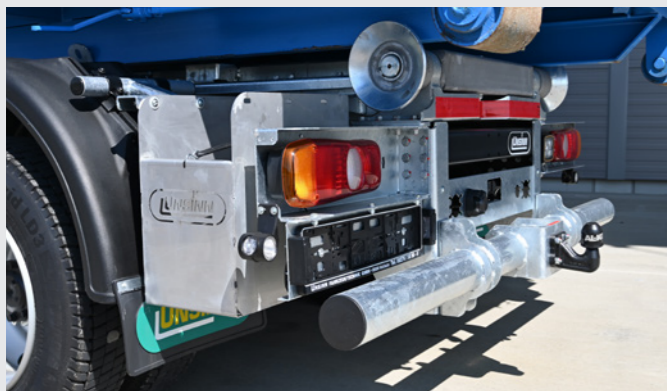
Heckunterfahrerschutz mit Kugelkopfkupplung